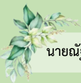
นายณัฐวัตร นาคไพจิตร นักเรียนชั้นมัธยมศึกษาปีที่ ๔/๓