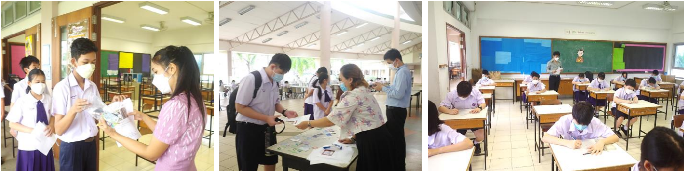
นักเรียนระดับชั้นประถมศึกษาปีที่ ๖ เมื่อวันที่เสาร์ที่ ๑๒ กุมภาพันธ์ ๒๕๖๕ เวลา ๐๙.๐๐-๑๖.๐๐ น.