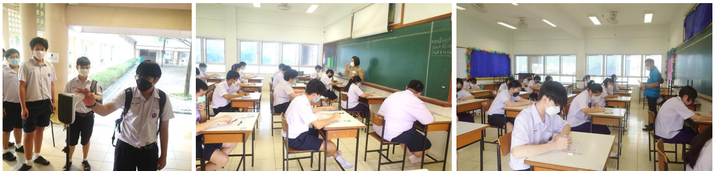
นักเรียนระดับชั้นมัธยมศึกษาปีที่ ๓ เมื่อวันที่อาทิตย์ที่ ๑๓ กุมภาพันธ์ ๒๕๖๕ เวลา ๐๘.๓๐-๑๖.๓๐ น.