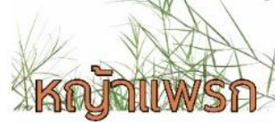
หญ้าแพรก

ในสมัยโบราณ สิ่งที่ขาดไม่ได้ในการไหว้ครู คือ ดอกมะเขือ หญ้าแพรก ข้าวตอก และดอกเข็ม ซึ่งสิ่งเหล่านี้ มีความหมายต่อการไหว้ครู ดังนี้