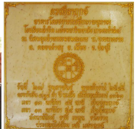
แผ่นดวงศิลาฤกษ์ บริเวณอาคาร ๑-๒