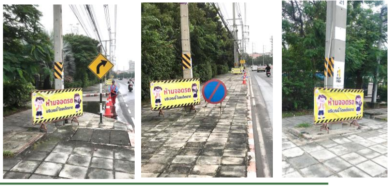
สนับสนุนการจัดทำ “ป้ายจราจร” สำหรับติดตั้งบริเวณทางเดินเท้า ด้านนอกโรงเรียน