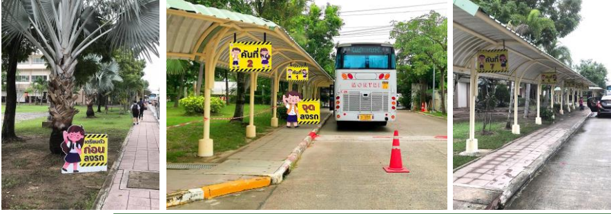
สนับสนุนการจัดทำ “ป้ายจุดจอดรถ” สำหรับผู้ปกครอง บริเวณทางเดินรถ ประตู ๔ ถึงประตู ๑

งานสมาคมผู้ปกครองและครู โรงเรียนสาธิตแห่งมหาวิทยาลัยเกษตรศาสตร์ โครงการการศึกษาพหุภาษา สนับสนุนการจัดทำป้ายจุดจอดรถสำหรับผู้ปกครอง และสนับสนุนค่าปรับปรุงลานจอดรถด้านข้างโรงเรียน โดยโรยหินคลุก ปรับพื้นที่ และขุดร่องน้ำ