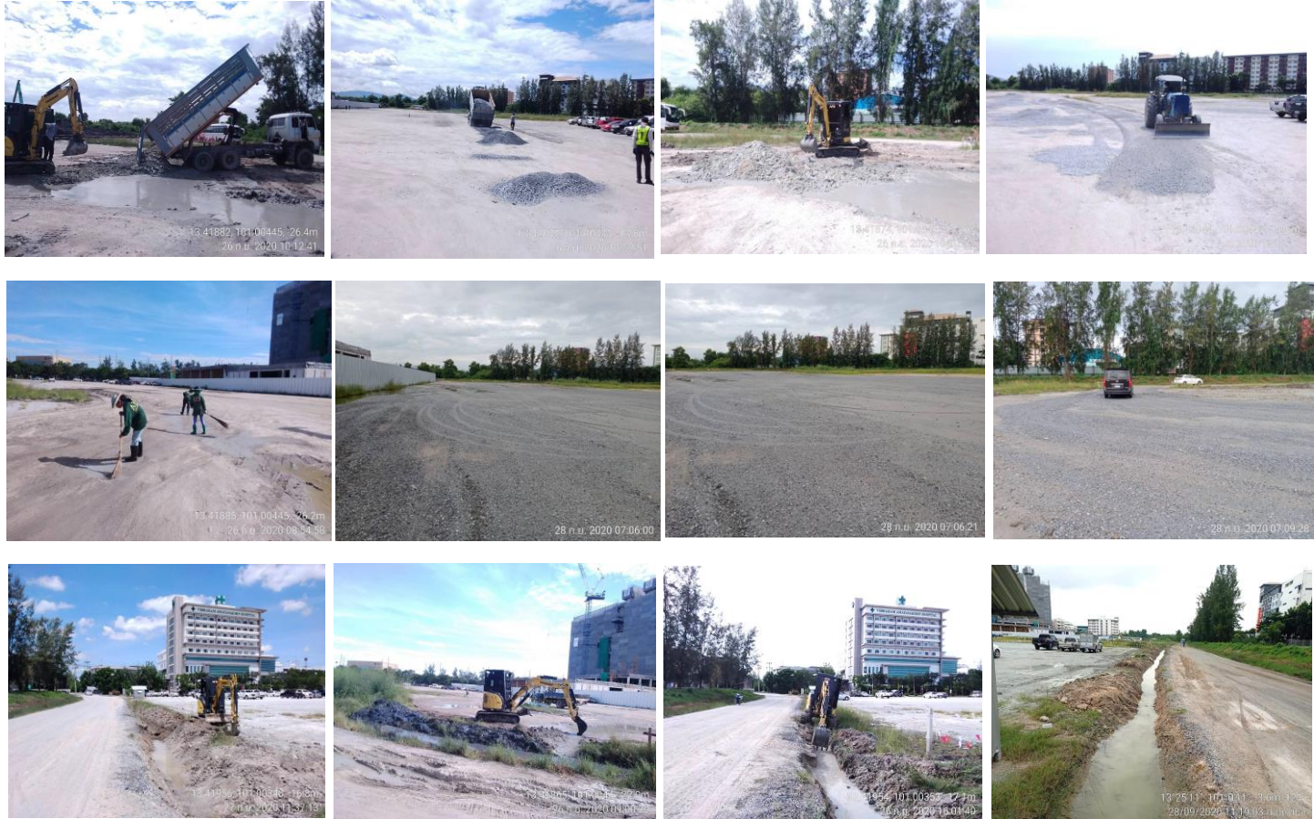
สนับสนุนการปรับปรุงลานจอดรถด้านข้างโรงเรียน โดยโรยหินคลุก ปรับพื้นที่ และขุดร่องน้ำ