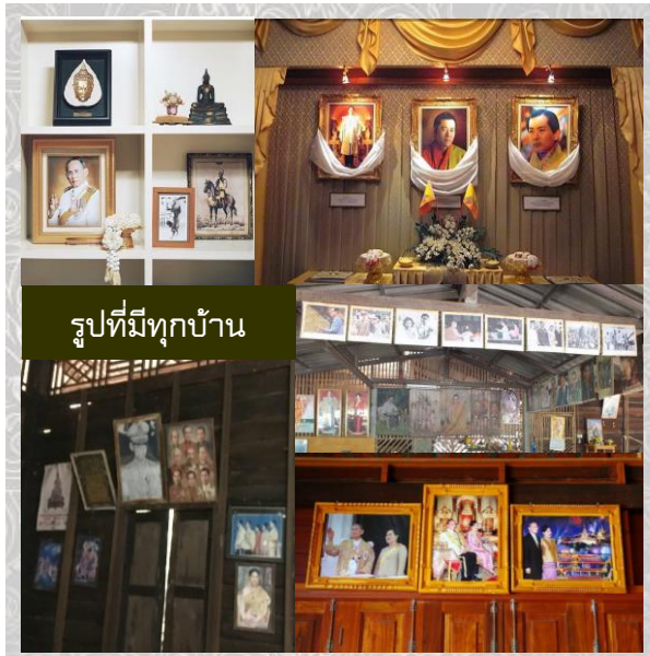
รูปที่มีทุกบ้าน

เมื่อเรียนจบผมได้งานที่ต่างประเทศ ผมบอกพ่อว่า จะไม่เข้าร่วมพิธีรับพระราชทานปริญญาบัตร เพราะบริษัทต่างประเทศ จะไม่รอกหากไปช้า พ่อบอกว่า "เรื่องงานช่างมัน แต่แกต้องรอรับปริญญาจากในหลวง" ตลอดชีวิตพ่อแทบไม่เคยจากบ้านไปไหน แต่พ่อยอมทิ้งงานและรายได้เพื่อเป็นประจักษ์พยานลูกรับปริญญาบัตรจากพระหัตถ์ของเจ้าแผ่นดิน