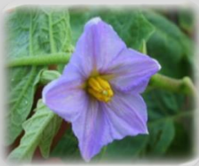
ดอกมะเขือ

สัญลักษณ์ของความมีสัมมาคารวะ และอ่อนน้อมถ่อมตน