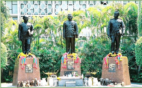
ลนสาวรีย์สามกษัตริย์ หรือ ลนสาวรีย์สามเสด็จแห่งเกษตร