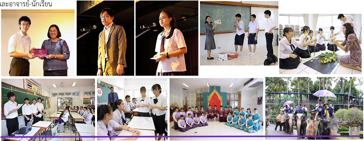
พิธีมอบประกาศนียบัตรแก่ครอบครัวเจ้าภาพ โครงการแลกเปลี่ยนการศึกษา ภาษา และวัฒนธรรม เมื่อวันที่ ๒๑ ตุลาคม พ.ศ.๒๕๖๒ เวลา ๑๕.๓๐ - ๑๖.๓๐ น. ณ ห้องประชุมเล็ก อาคารหอประชุม