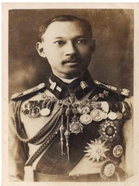
อ้างอิง : http://guru.sanook.com/

ด้วยพระปรีชาสามารถของ พลเอก พระเจ้าบรมวงศ์เธอ กรมพระกำแพงเพชรอัครโยธิน กิจการรถไฟได้เจริญก้าวหน้าสูงสุดในยุคที่พระองค์ทรงเป็น ผู้บัญชาการ พระองค์ทรงมีพระปณิธานแน่วแน่ที่จะทำให้ประเทศไทยเป็นศูนย์กลางการคมนาคมและเศรษฐกิจของภูมิภาคด้วยการสร้างทางรถไฟเชื่อมต่อถึงกัน แต่น่าเสียดายที่พระองค์สิ้นพระชนม์เมื่อวันที่ ๑๔ กันยายน ๒๔๗๙ อย่างไรก็ตามก็ได้รับสถาปนาโดยคณะราษฎรให้เป็นที่ระลึกถึงพระคุณที่ทรงสร้างทางรถไฟเชื่อมกับประเทศเพื่อนบ้านตามพระราชดำริไว้ พลเอก พระเจ้าบรมวงศ์เธอ กรมพระกำแพงเพชรอัครโยธิน ทรงสิ้นพระชนม์ด้วยโรคพระทัยวาย ณ โรงพยาบาลในเมืองสิงคโปร์ เมื่อวันที่ ๑๔ กันยายน ๒๔๗๙ รวมพระชันษาได้ ๕๔ ปี ๗ เดือน ๒๒ วัน แม้ว่าพระองค์จะทรงสิ้นพระชนม์ไปแล้ว แต่พระกรณียกิจและพระดำริที่ทรงสร้างสรรคไว้ยังคงเป็นอนุสรณ์แห่งแห่งพระปรีชาสามารถและพระวิริยะอุตสาหะที่ยากจะหาผู้ใดเสมอเหมือนได้ ทางราชการได้ตระหนักถึงพระกรุณาธิคุณอันเหลือคณานับของพระองค์ท่าน จึงกำหนดให้วันที่ ๑๔ กันยายนของทุกปี เป็น "วันบูรณัตร์"และการรถไฟแห่งประเทศไทยได้จัดกิจกรรมเพื่อน้อมรำลึกถึงพระกรุณาธิคุณและพระกรณียกิจของ พระองค์ที่มีต่อประชาชนและประเทศไทยสืบไป