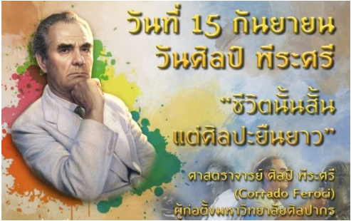
อ้างอิง : http://www.tlcthai.com/