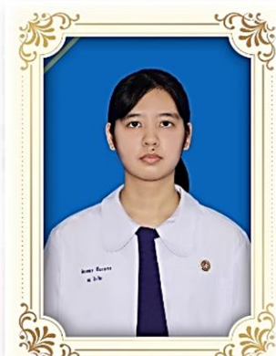
ระดับยอดเยี่ยม