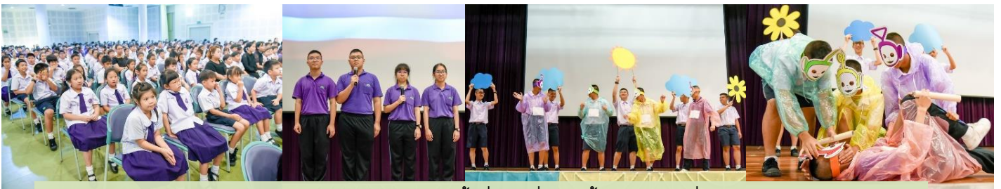
ประชาสัมพันธ์กิจกรรมกีฬาสัมพันธ์ ครั้งที่ ๑๕ ที่จะจัดขึ้นในวันศุกร์ที่ ๒๕ สิงหาคม