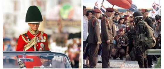
ฉลองพระองค์ชุดทหารมหาดเล็กรักษาพระองค์ และชุดทหาร