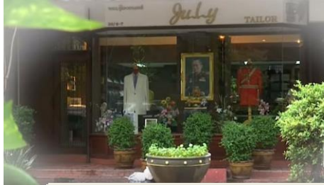
ร้านตัดเสื้อโลโก้ ซอยศาลาแดง ถนนสีลม ร้านตัดฉลองพระองค์ของในหลวงรัชกาลที่ ๙ ตั้งแต่ปี พ.ศ.๒๕๐๓