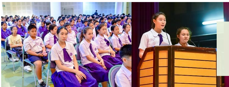
กิจกรรมหน้าเสาธง ประชาสัมพันธ์ “โครงการสัปดาห์สนทนาศิษย์-ลูก” ประจำปีการศึกษา ๒๕๖๐