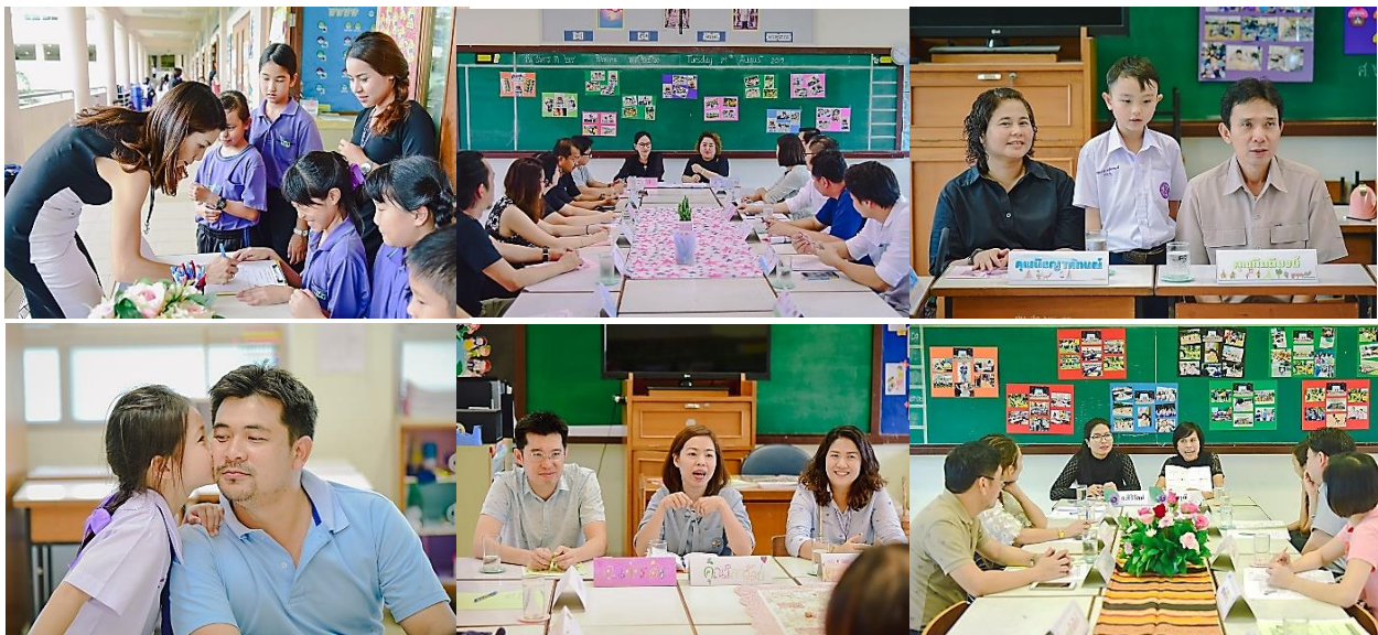
นิทรรศการและสนทนากับอาจารย์หลักสูตรภาษาต่างประเทศ

โรงเรียนสาธิตแห่งมหาวิทยาลัยเกษตรศาสตร์ ศูนย์วิจัยและพัฒนาการศึกษา จัดกิจกรรมสัปดาห์สนทนาศิษย์-ลูก สำหรับผู้ปกครองนักเรียนระดับชั้นชั้นประถมศึกษาปีที่ ๑ - ๖ ประจำปีการศึกษา ๒๕๖๐ ระหว่างวันที่ ๒๙ - ๓๑ สิงหาคม ๒๕๖๐