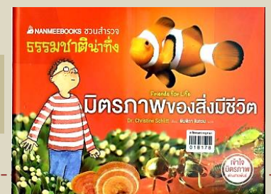
ชลิตท์.คริสทีน. ๒๕๕๙. มิตรภาพของสิ่งมีชีวิต. กรุงเทพฯ : นานามีบุคส์.

หนังสือเล่มนี้จะชี้แนะแนวทางการเลี้ยงลูกและแนวทางการจัดการศึกษาแก่เด็ก เพื่อให้เด็กเติบโตเต็มศักยภาพ ภายใต้ผลการวิจัยที่ชี้ว่า ทั้งความฉลาด หรือคุณสมบัติด้านสติปัญญา และลักษณะนิสัย เป็นสิ่งที่ฝึกได้และความสำเร็จในชีวิตคนเรานั้นไม่ได้ขึ้นอยู่กับความฉลาดเท่านั้นแต่ยังขึ้นกับลักษณะนิสัยด้วย "เลี้ยงให้รุ่ง" เป็นหนังสือที่อ่านสนุกที่ อัดแน่นด้วยเรื่องเล่าและข้อมูล ซึ่งจะทำให้เราเห็นว่าใครบ้างที่ประสบความสำเร็จ ใครบ้างที่ล้มเหลว เราจะทำอะไรได้บ้างเพื่อนำทางเด็กให้ห่างไกลจากความล้มเหลวและจะเอื้อมให้ถึงความสำเร็จได้อย่างไร