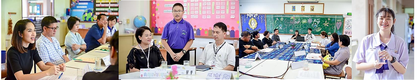
นิทรรศการและสนทนากับอาจารย์หลักสูตรภาษาต่างประเทศ

โรงเรียนสาธิตแห่งมหาวิทยาลัยเกษตรศาสตร์ ศูนย์วิจัยและพัฒนาการศึกษา จัดกิจกรรมสัปดาห์สหนานาชาติ-ลูก สำหรับผู้ปกครองนักเรียนระดับชั้นมัธยมศึกษาปีที่ ๑ - ๕ ประจำปีการศึกษา ๒๕๖๐ ระหว่างวันที่ ๕ - ๗ กันยายน ๒๕๖๐