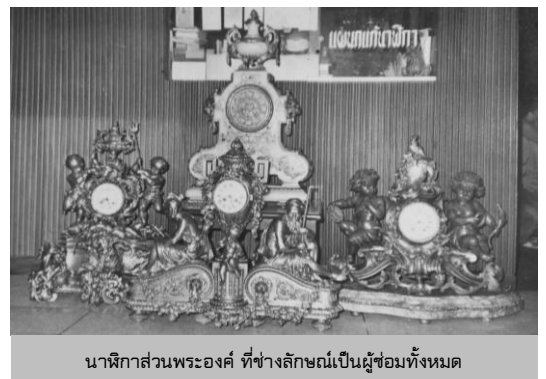
นาฬิกาส่วนพระองค์ ที่ช่างลักษณะเป็นผู้ซ่อมทั้งหมด