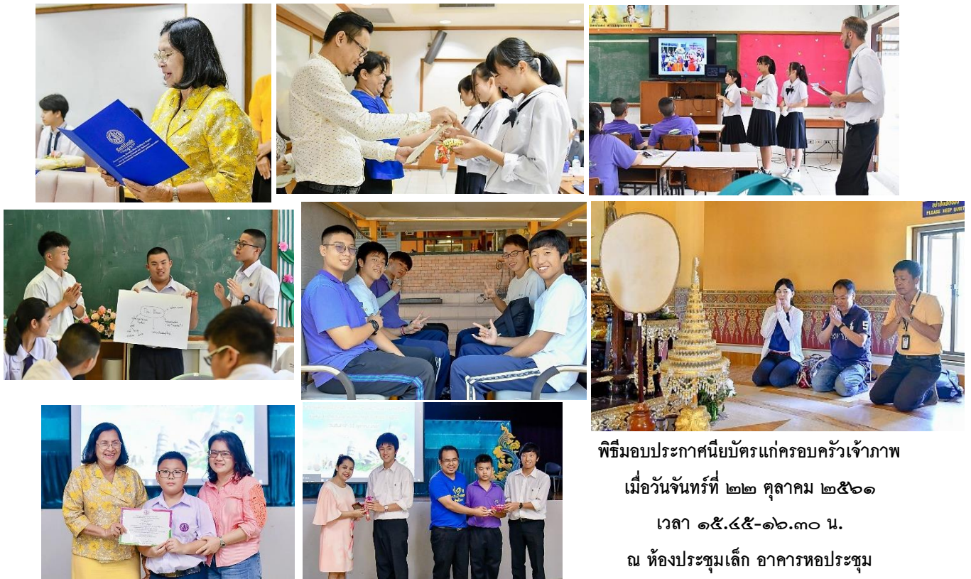
พิธีมอบประกาศนียบัตรแก่ครอบครัวเจ้าภาพ เมื่อวันที่จันทร์ที่ ๒๒ ตุลาคม ๒๕๖๑ เวลา ๑๕.๔๕-๑๖.๓๐ น. ณ ห้องประชุมเล็ก อาคารหอประชุม

โรงเรียนสาธิตแห่งมหาวิทยาลัยเกษตรศาสตร์ โครงการการศึกษาพหุภาษา ค้อนรับอาจารย์และนักเรียนโครงการแลกเปลี่ยนการศึกษา ภาษาและวัฒนธรรม (ครั้งที่ ๕) Satit Kaset MP Lab School - Fukui Prefectural Koshi High School, JAPAN นักเรียน ญีปุ่นร่วมเรียนและทำกิจกรรมกับระดับชั้นมัธยมศึกษาปีที่ ๔ และมัธยมศึกษาปีที่ ๕ ระหว่างวันที่ ๒๒ - ๒๕ ตุลาคม ๒๕๖๑ โดยมี คณะกรรมการงานบริการวิชาการและวิเทศสัมพันธ์ เป็นเจ้าภาพต้อนรับร่วมกับอาจารย์และนักเรียนชั้นมัธยมศึกษาปีที่ ๔ พร้อมทั้ง ทัศนศึกษาที่ ณ วัดญาณสังวราราม, วิหารเซียน และ หาดแหลมแท่น จังหวัดชลบุรี